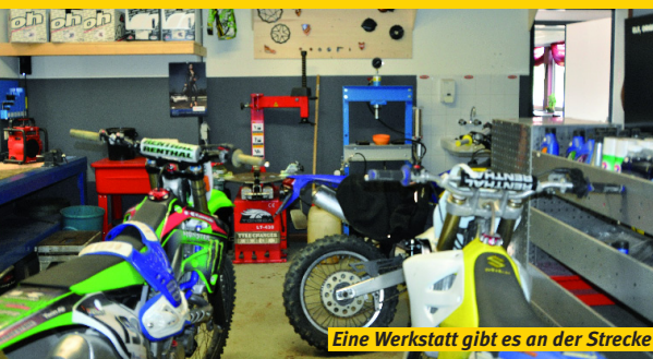
Eine Werkstatt gibt es an der Strecke

Fahrerlager ist befestigt und auch für große Lkws geeignet. 220-Volt-Stroman-schlüsse für 240 Fahrer sind vorhanden.