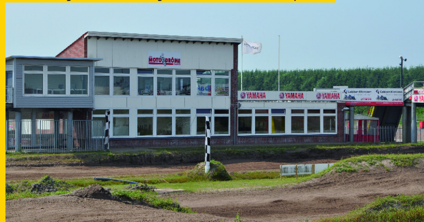
Ein Sandtraining hat noch niemanden geschadet und der Track ist bereit für euch