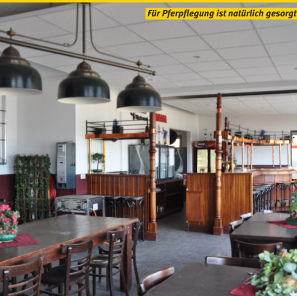
Für Pferpflegung ist natürlich gesorgt

Außen bei der Kantine gibt es Duschen und Toiletten, einschließlich Behinderten-WC, die 24 Stunden geöffnet sind. Im